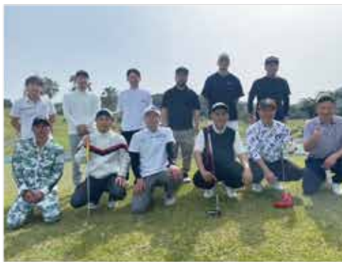
スタート前に参加者で記念撮影 ＝湯の浦カントリー倶楽部

令和六年三月三十日(土)に湯の浦カントリー倶楽部で行い、表彰式と懇親会を居酒屋で開催しました。