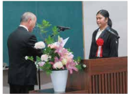
5年表彰代表受賞者 ＝商工会議所3階会議室