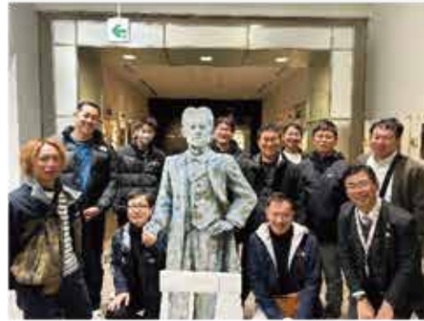
参加者全員で記念撮影 ＝大阪企業家ミュージアム

まず大阪企業家ミュージアムにて、鹿児島出身で大阪商工会議所の設立に大きく影響を及ぼした五代友厚や、多くの企業家が大阪に集まった理由等説明を聞きまし