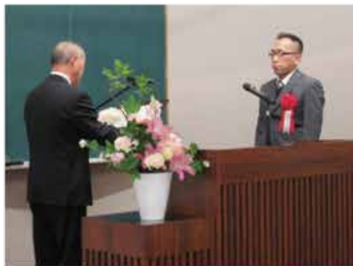
10年表彰代表受賞者 = 商工会議所3階会議室