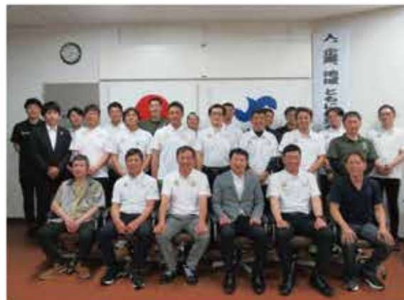
総会終了後記念撮影＝商工会議所2階会議室

令和五年度の事業経過報告並びに収支決算(案)、令和六年度の事業計画(案)並びに収支予算(案)が審議され、原案通り承認されました。