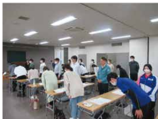
美しいお辞儀の練習=商工会議所3階会議室

まず、ビジネスマナーの練習を兼ねて、面識のない者同士が隣り合うように席替えを行い、二人組で美しいお辞儀ができているか確認したり、名刺交換の練習をしたりと、最初は緊張している様子でしたが、徐々にほぐれてい