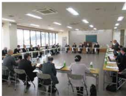
南さつま市、南薩地域振興局や各団体関係者が出席した懇談会 = 商工会議所3階会議室

令和六年三月二十二日（金）に当所と南さつま市商工会で構成する南さつま市商工団体協議会は、南さつま市と南薩地域振興局と令和五年度の行政懇談会を開催者約三十名が出席して開催しました。