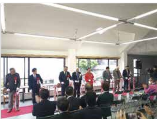
テープカットの様子＝きやったもんせ南さつま2階

一階は南さつま市の特産品を販売しており、二階はコワーキングスペースとしても活用できます。ぜひお立ち寄りください。