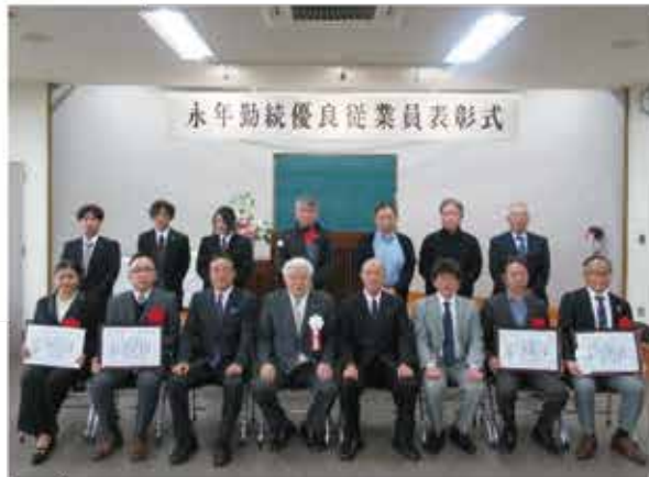
受賞者と正副会頭で記念撮影＝商工会議所3階会議室