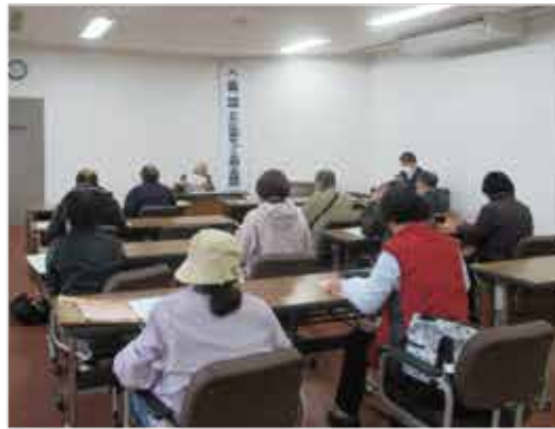
総会の様子=商工会議所2階会議室

加世田地区青色申告会総会を二月一日(木)、開催しました。令和五年の事業報告並びに収支決算(案)の報告があり原案通り承認された後、令和六年の事業計画(案)並びに収支予算(案)を審議し、原案通り承認されました。