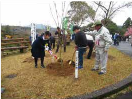
記念植樹の様子＝金峰2000年橋公園

式典後小雨の降る中、一二〇本のイロハモミジを参加者全員で植樹しました。 令和六年度は枕崎市での開催となります。