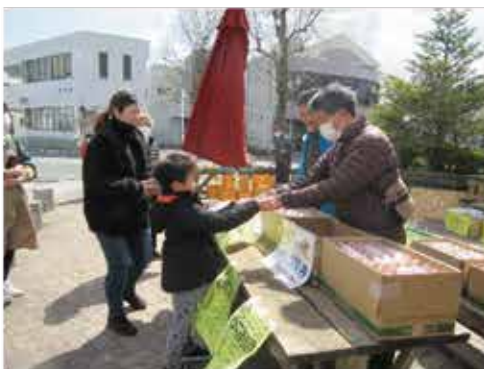
子ども広場の様子 ＝加世田ゆめびか本町ポシェット広場

参加店でも百円の商品や百円引きの商品など、百縁市ならではのお楽しみ商品もありました。