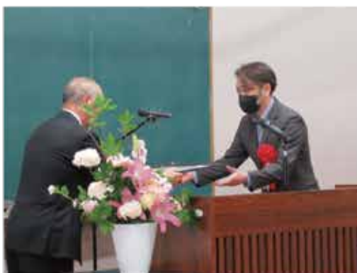
20年表彰代表受賞者 = 商工会議所3階会議室