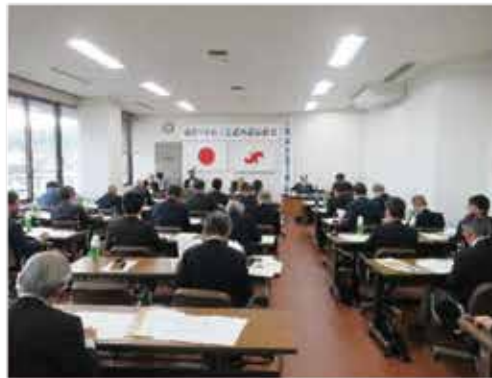
第335回議員総会の模様 ＝商工会議所2階会議室

三月二十七日(水)通常議員総会が、当商工会議所二階会議室で開催され、議案はすべて原案通り承認可決されました。