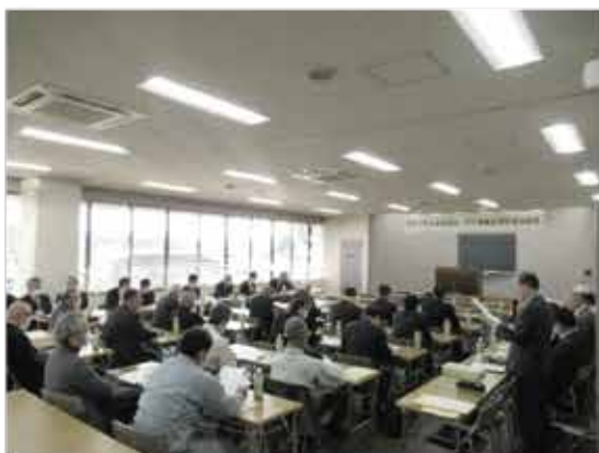
多くの来賓と会員が出席した協議会総会 = 商工会議所3階会議室

国道二七〇号、二二六号や県道などの幹線道路、南さつま市の市道、市内の河川まで含めた整備促進を目的に南さつま市の商工、農業、漁業団体などの関係機関や企業、個人で構成する「南さつま広域圏道路・河川整備促進協議会」が、令和五年九月末での令和四年度事業終了を受けて総会を令和六年一月十七日（水）に当所会議室で多くの来賓と会員の出席のもと開催しました。