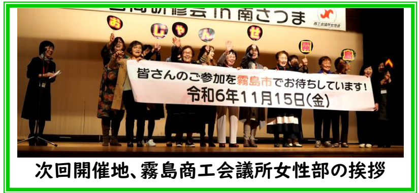
次回開催地、霧島商工会議所女性部の挨拶