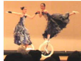
「鹿児島益山一輪車クラブ」による演技に大感激