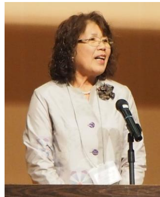
宇都実行委員長 挨拶