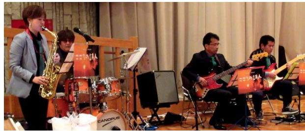
「濱崎こころバンド」による演奏

会場内は皆さんの 手拍子で／リ／リ 立ち上がって踊り 出す人もいて・・・ 大盛況 でした。